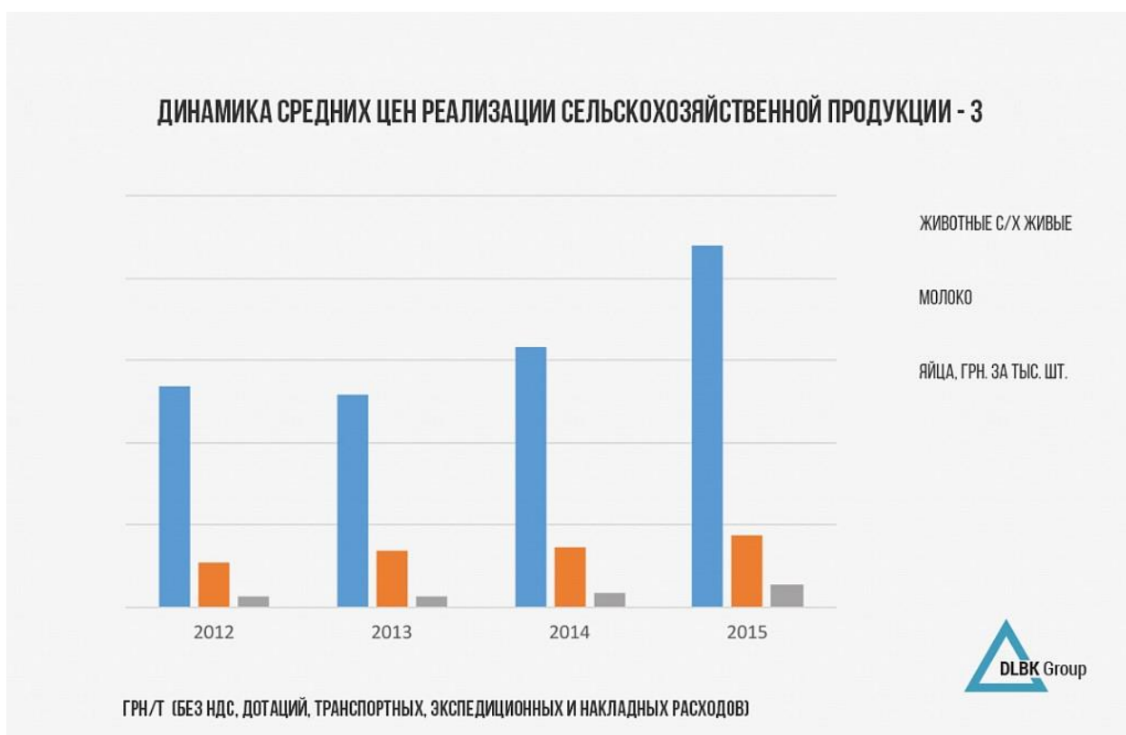
Рис. 3.2. Средние цены реализации сельскохозяйственной продукции